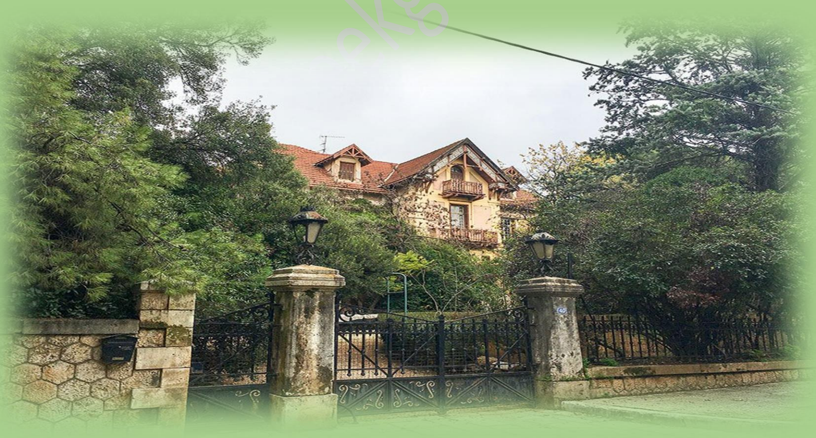
Οικία Εμμ. Μπενάκη. Το ελληνοελβετικό στυλ καθιερώθηκε από τον Τσίλλερ.

Μεταξύ αυτών και η οικία της κεφαλλονίτικης οικογένειας Βαλλιάνου, στην οποία οφείλουμε το κτίριο όπου στεγαζόταν μέχρι πρότινος η Εθνική Βιβλιοθήκη στην Πανεπιστημίου. Χτισμένη γύρω στο 1890, περιβάλλεται από πελώριο κήπο, όπως όλες οι παραθεριστικές κατοικίες, και θυμίζει κατά πολύ τα αγροτόσπιτα που βλέπει κανείς στη Γερμανία ή στην Ελβετία.