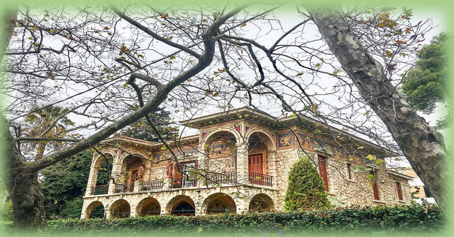
Επαυλη «Ατλαντίς». Ζωγραφική διακόσμηση με επιρροές από την Πομπηία.

Συνεχίζω επί της Πεσμαζόγλου, θαυμάζοντας καθ' οδόν διάφορα περίτεχνα αρχιτεκτονήματα, για να βγω στην πολύβουη Τατοΐου, όπου στρίβω αριστερά. Τελειώνω τη βόλτα μου έξω από την έπαυλη «Πύρνα» που κτίστηκε μεταξύ 1910 και 1919 και είναι μία από τις λίγες κατοικίες της Κηφισιάς που δεν ακολουθούν την εκλεκτικιστική αρχιτεκτονική του υπόλοιπου προαστίου αλλά τον νεοκλασικισμό. Το όνομά της οφείλει στο παρακείμενο αρχαίο ρέμα της Πύρνας (ή Κοκκιναρά), παραπόταμο του Κηφισού, που, αν και άνυδρο πια, μας υπενθυμίζει τα άφθονα νερά που κάποτε έτρεχαν εδώ και μας βοηθάει να φανταστούμε την Κηφισιά που αντίκριζαν καθημερινά οι Αθηναίοι παραθεριστές της μακρινής εκείνης Μπελ Επόκ.