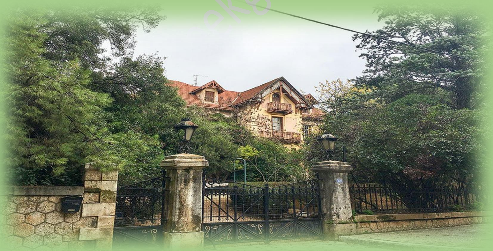
Οικία Εμμ. Μπενάκη. Το ελληνοελβετικό στυλ καθιερώθηκε από τον Τσίλλερ.

Μεταξύ αυτών και η οικία της κεφαλονίτικης οικογένειας Βαλλιάνου, στην οποία οφείλουμε το κτίριο όπου στεγαζόταν μέχρι πρότινος η Εθνική Βιβλιοθήκη στην Πανεπιστημίου. Χτισμένη γύρω στο 1890, περιβάλλεται από πελώριο κήπο, όπως όλες οι παραθεριστικές κατοικίες, και θυμίζει κατά πολύ τα αγροτόσπιτα που βλέπει κανείς στη Γερμανία ή στην Ελβετία.